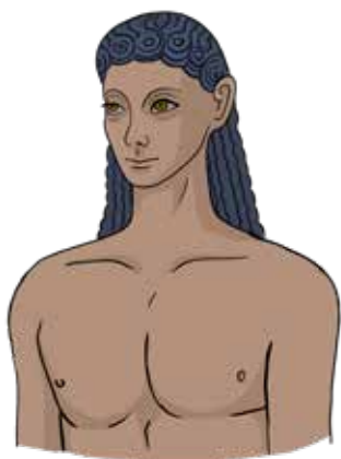
Ο Κούρος της Μήλου

Με έφτιαξε γύρω στα 550 π.Χ. ένας κυκλαδίτης καλλιτέχνης. Κάποτε στεκόμουν πάνω στον τάφο ενός νέου άνδρα, πανύψηλος, γυμνός, γελαστός, με τα μαλλιά να πέφτουν πίσω, στη ράχη. Με ανακάλυψαν μετά από πολλούς αιώνες, το 1891 και με μετέφεραν στην Αθήνα. Από τότε αποτελώ ένα από τα θαυμαστά εκθέματα της συλλογής των γλυπτών του Εθνικού Αρχαιολογικού Μουσείου. Μαζί θα δούμε μια επιγραφή γραμμένη σε μπλιακό αλφάβητο. Το αλφάβητο αυτό αποτελεί μια από τις παλαιότερες μορφές του ελληνικού αλφαβήτου, ακολουθεί τη δωρική διάλεκτο και το χρησιμοποιούσαν στη Μήλο μέχρι περίπου το 416 π.Χ.