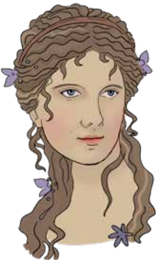
Αφροδίτη της Μήλου

Εκεί αποκαλύφθηκε και η ερμαϊκή μαρμαρίνη στήλη που παριστάνει έναν άντρα, ο οποίος φορά πάνω από τον χιτώνα του το δέρμα ενός πάνθηρα. Μπορείς να την βρεις μέσα στο μουσείο;