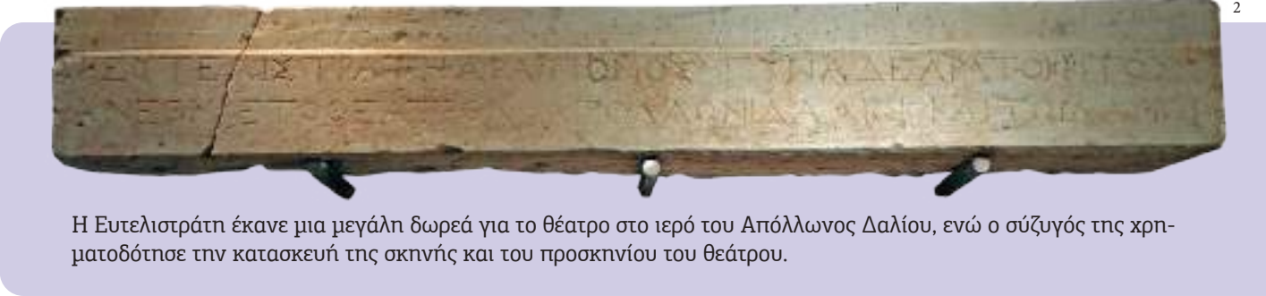
Η Ευτελιστράτη έκανε μια μεγάλη δωρεά για το θέατρο στο ιερό του Απόλλωνος Δαλίου, ενώ ο σύζυγός της χρηματοδότησε την κατασκευή της σκηνής και του προσκηνίου του θεάτρου.

Το όνομα της Ευτελιστράτης δεν είναι το μοναδικό που αναφέρεται στην επιγραφή. Υπάρχουν ακόμα δύο κύρια ονόματα. Ποια είναι αυτά;